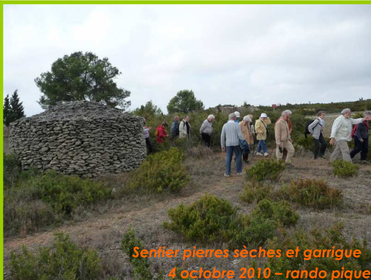
Sentier pierres sèches et garrigue 4 octobre 2010 – rando pique-nique :