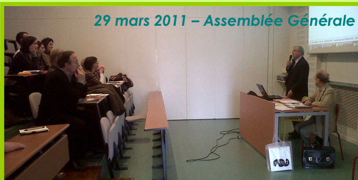
29 mars 2011 – Assemblée Générale