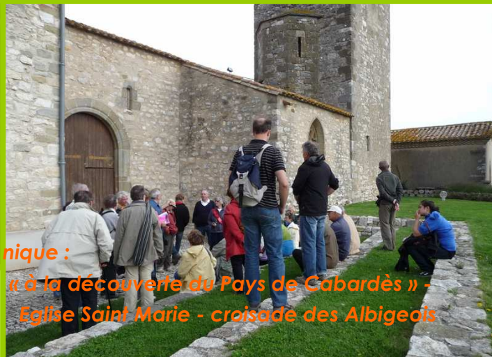
« à la découverte du Pays de Cabardès » - Eglise Saint Marie - croisade des Albigeois