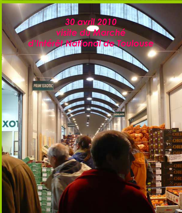
30 avril 2010 visite du Marché d'Intérêt National de Toulouse